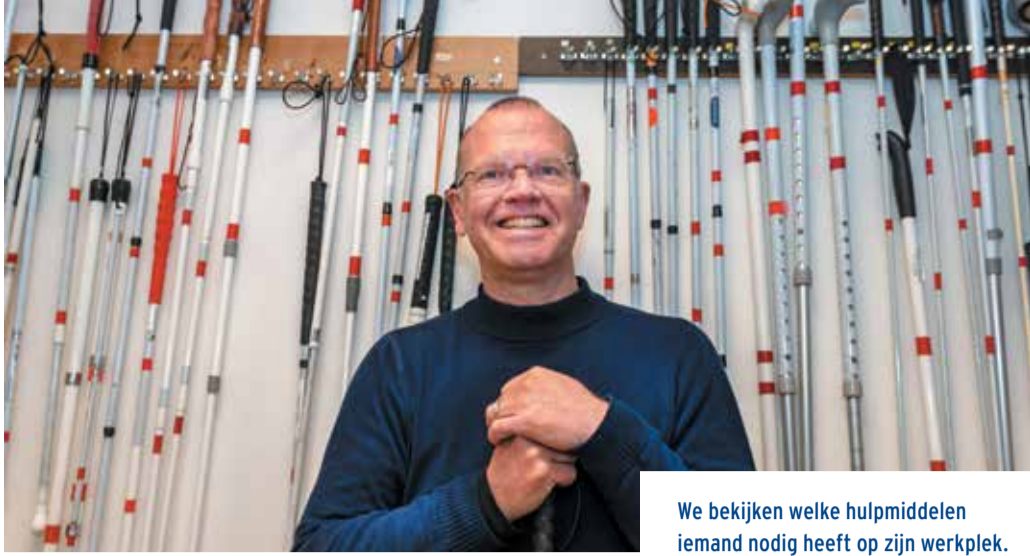
We bekijken welke hulpmiddelen iemand nodig heeft op zijn werkplek.

verdienen, zodat hij geen uitkering meer nodig heeft, want 'Nederland heeft al zoveel voor mij gedaan.' Het lijkt erop dat mensen met een beperking een waardevolle aanvulling zijn voor een bedrijf. "Ze zorgen voor minder ziekteverzuim. Collega's realiseren zich wat een visueel beperkte collega allemaal moet doen om bijvoorbeeld op tijd op zijn werk te zijn. De drempel om zich dan ziek te melden wordt hierdoor hoger."