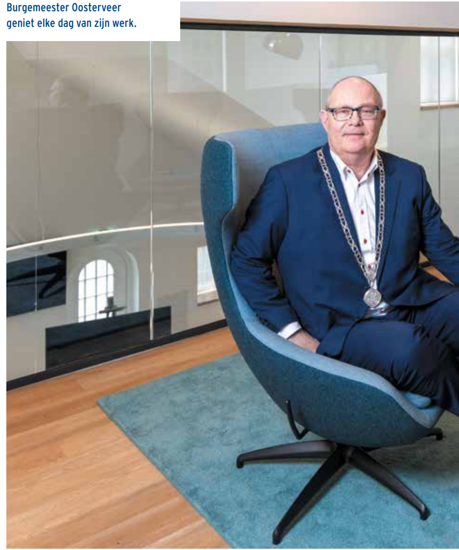
Burgemeester Oosterveer geniet elke dag van zijn werk.