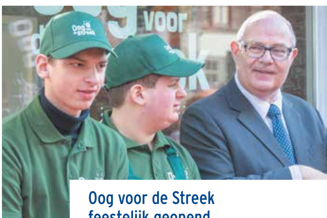
Oog voor de Streek feestelijk geopend