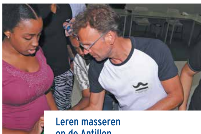
Leren masseren op de Antillen