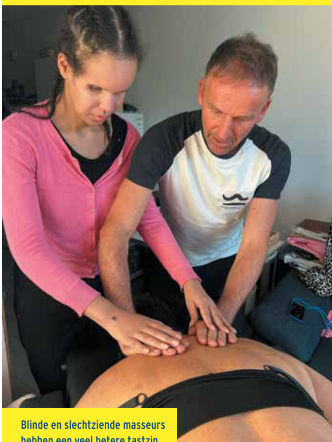
Blinde en slechtziende masseurs hebben een veel betere tastzin.

Klopt. Ik doe dit project samen met de Zorg en Welzijn groep en zij hebben al tien zeer enthousiaste deelnemers geworven. Net als op Curaçao geef ik de 10-daagse opleiding binnen de twee weken. Dat kan op zich prima, de cursisten zullen door deze versnelling tussendoor wel wat minder op vrienden en bekenden kunnen oefenen. Verder kunnen cursisten elkaar niet echt corrigeren, dat ligt op mijn bordje. Misschien dat ik daarom nog een collega meeneem naar Bonaire. ■