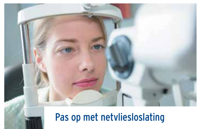
Pas op met netvliesloslating