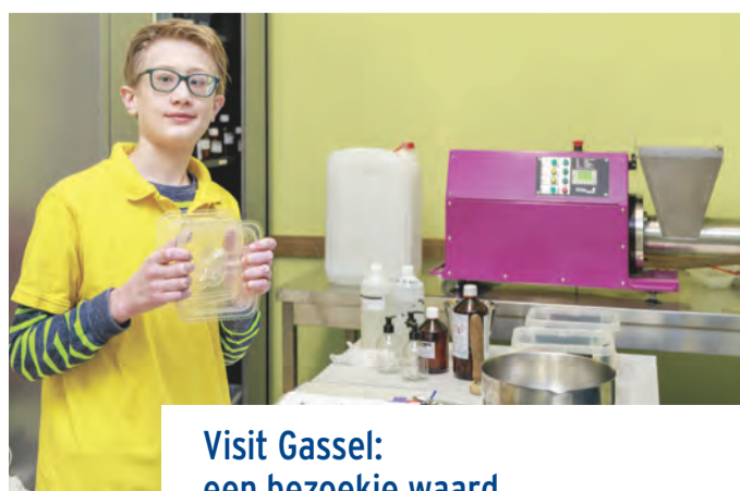
Visit Gassel: een bezoekje waard