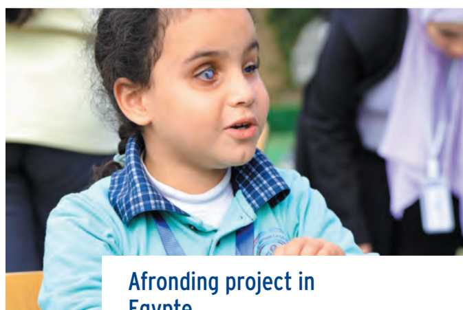
Afronding project in Egypte