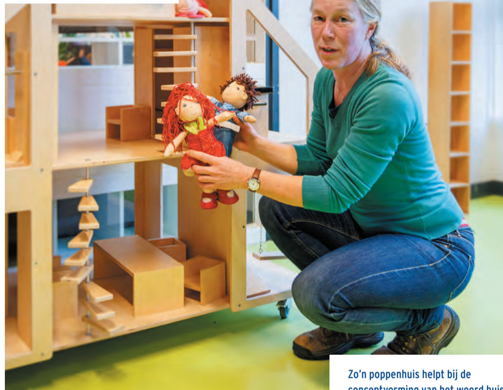
Zo'n poppenhuis helpt bij de conceptvorming van het woord huis.

Het gebruik van woorden waarvan het kind niet goed weet wat ze precies betekenen, wordt zweeftaal genoemd. “Vaak kom je erachter door hen te vragen er meer over te vertellen”, legt Van Aken uit. “Zo kun je vergissingen of gaten in de kennis opsporen en ze meteen leren hoe het wel in elkaar steekt. Met zachte hand vanzelfsprekend. Want het is voor een kind soms even slikken als hun