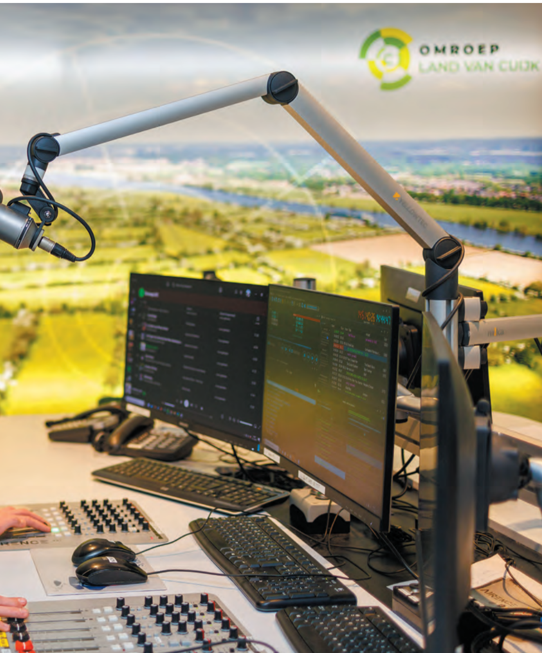
Marijn voelt zich als een vis in het water in de studio.