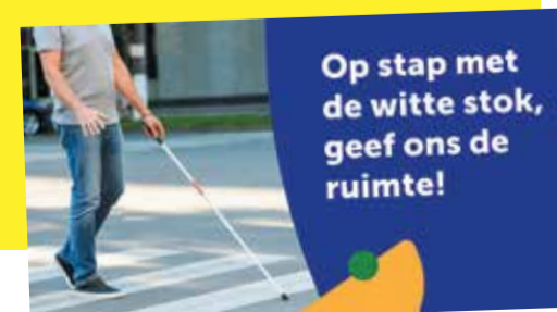
Op stap met de witte stok, geef ons de ruimte!

Jaarlijks vindt op 15 oktober de Dag van de Witte Stok plaats. Dan gaan mensen met een taststok de straat op om aandacht te vragen voor het gebruik van de taststok in de openbare ruimte. Dit jaar is het thema: ‘Op pad met de witte stok, geef ons de ruimte!’. Op de Dag van de Witte Stok organiseert de Oogvereniging acties door heel Nederland. Van wandelingen met lokale politici tot parcoursen voor voorbijgangers op straat, deze activiteiten dragen bij aan het bewustzijn van de maatschappij.