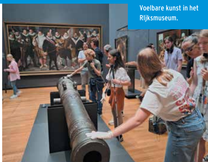
Voelbare kunst in het Rijksmuseum.