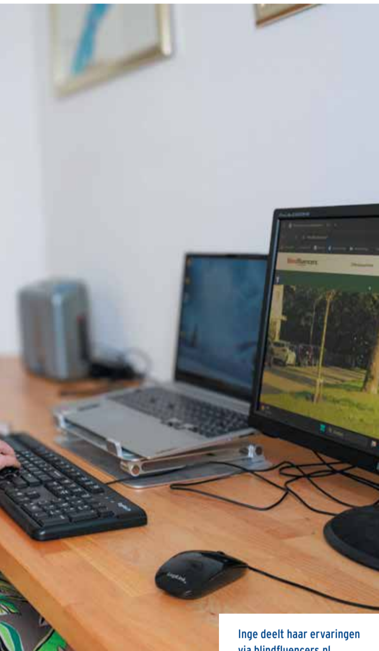
Inge deelt haar ervaringen via blindfluencers.nl

van anderen afhankelijk wil zijn." Gelukkig is iets nieuws leren haar tweede natuur. "Ik was altijd al ondernemend, doe graag nieuwe dingen en sta met mijn neus vooraan bij innovaties. Met mijn mobiel was ik zeker zo handig als de jonge millennials."