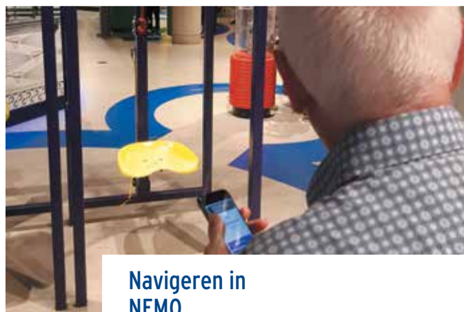
Navigeren in NEMO