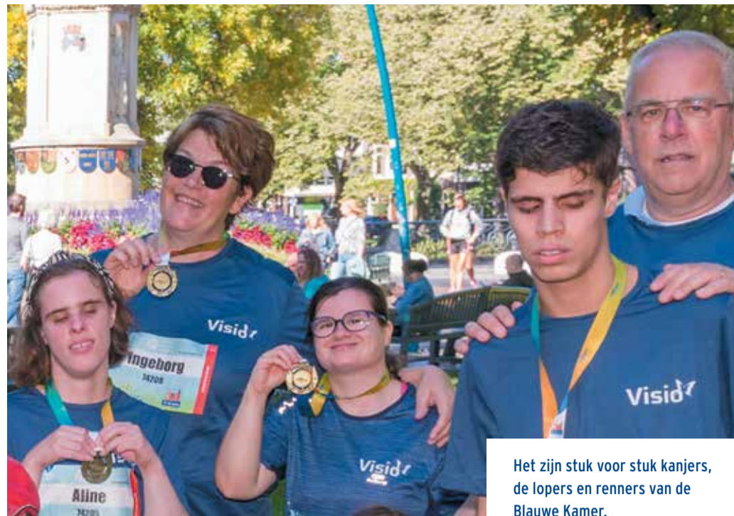
Het zijn stuk voor stuk kanjers, de lopers en renners van de Blauwe Kamer.

‘Meedoen mogelijk maken’ is een slogan van Koninklijke Visio. Dat werd bij de Singelloop in Breda zichtbaar gemaakt door de deelname van mensen met een verstandelijke en visuele beperking aan een loop en wandeling, die daadwerkelijk voor iedereen toegankelijk is. ■