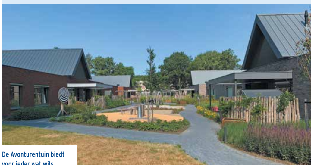
De Avonturentuin biedt voor ieder wat wils.

De droom van de Avonturentuin is werkelijkheid geworden dankzij meerdere giften, waaronder die van de KSBS. “Zonder geldschieters was het ons nooit gelukt. Onze bewoners genieten nu ieder op hun eigen niveau dagelijks van de tuin. Dat is heel wat waard.” ■