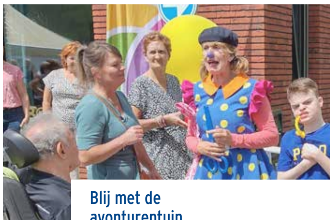
Blij met de avonturentuin